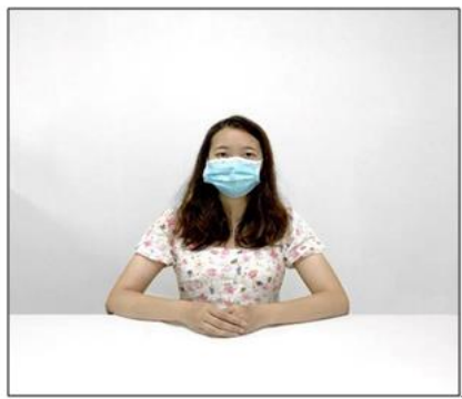
图2：正前方第一机位效果图